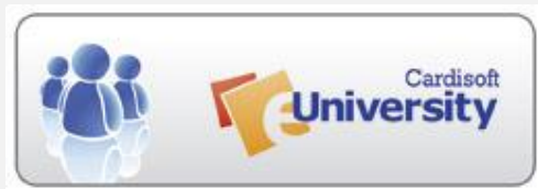
Student Information Services